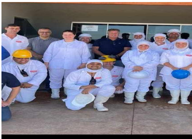
Figura: Equipe Boibras (fez parte da Vistoria/Habilitação China).

Após a vistoria em 15/janeiro pelo Comitê-China Online/Remoto (áudio conferencia) e houve “7 Não Conformidades” que foram sanadas a vistoria de finalização foi realizada em 28 de Fevereiro de 2024, agora estamos no aguardo do registro “oficial da habilitação China”.