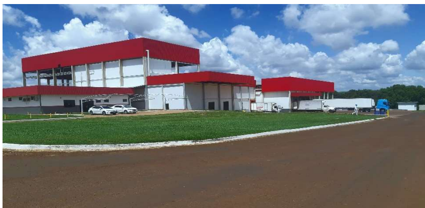
Figura 01: Prédio mais alto “sala de congelados e ampliação da desossa”

Com a parceria da BMG Foods houve a necessidade de ampliação da parte industrial “sala de congelados e ampliação da desossa” sendo assim gasto/investido no prédio (foto abaixo) e listagem de Material comprado para este setor predial.