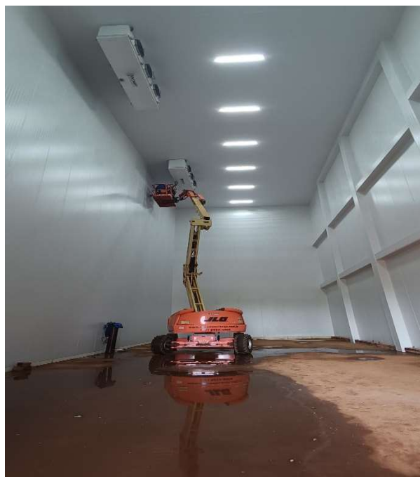
Figura 02: Prédio mais alto “sala de congelados e ampliação da desossa”