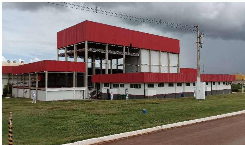
Figura 01: Prédio mais alto “sala de congelados e ampliação da desossa”

Com a parceria da BMG Foods houve a necessidade de ampliação da parte industrial “sala de congelados e ampliação da desossa” sendo assim gasto/investido no prédio (foto abaixo) e listagem de Material comprado para este setor predial.